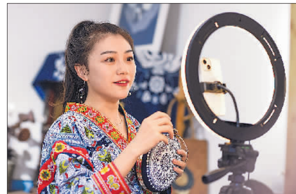
“蜡染姑娘”回乡传承非遗技艺

扎实做好站车防控工作。持续做好全路客运站测温、验码等工作,严防风险人员进站上车。(下转第3版)