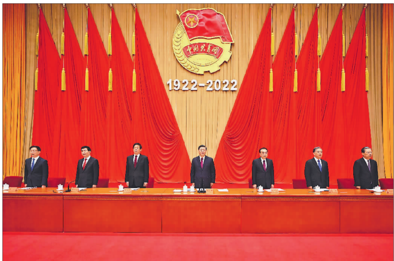
5月10日,庆祝中国共产主义青年团成立100周年大会在北京人民大会堂隆重举行。习近平、李克强、栗战书、汪洋、王沪宁、赵乐际、韩正等出席大会。